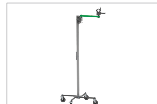
Hauteur max 2 300 mm avec la rallonge CB-3582G000