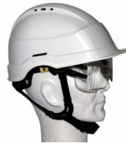
IRIS 2 48 mois