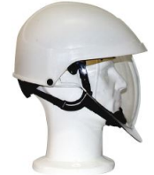
IDRA 2 48 mois