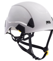
STRATO 120 mois