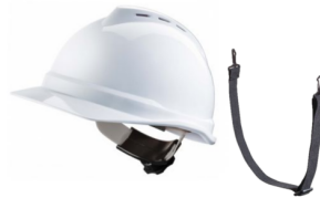
V Gard 60 mois