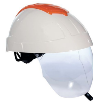
E MAN 60 mois

Comparez la date de fabrication avec le modèle de casque et sa périodicité associée