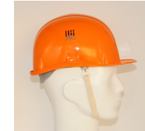
BRENNUS 36 mois