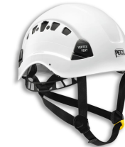
VERTEX 120 mois