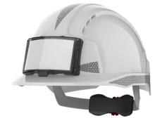
EVOLITE 60 mois