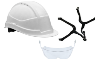
KARA 48 mois